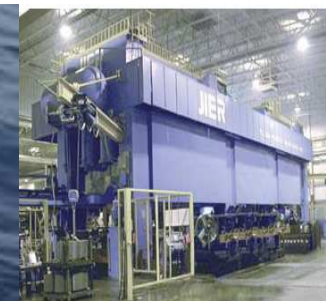
石化技不及装备展览云

数控机床与基础制造装备高峰论坛 CNC Machine Tools and Basic Manufacturing Equipment Forum