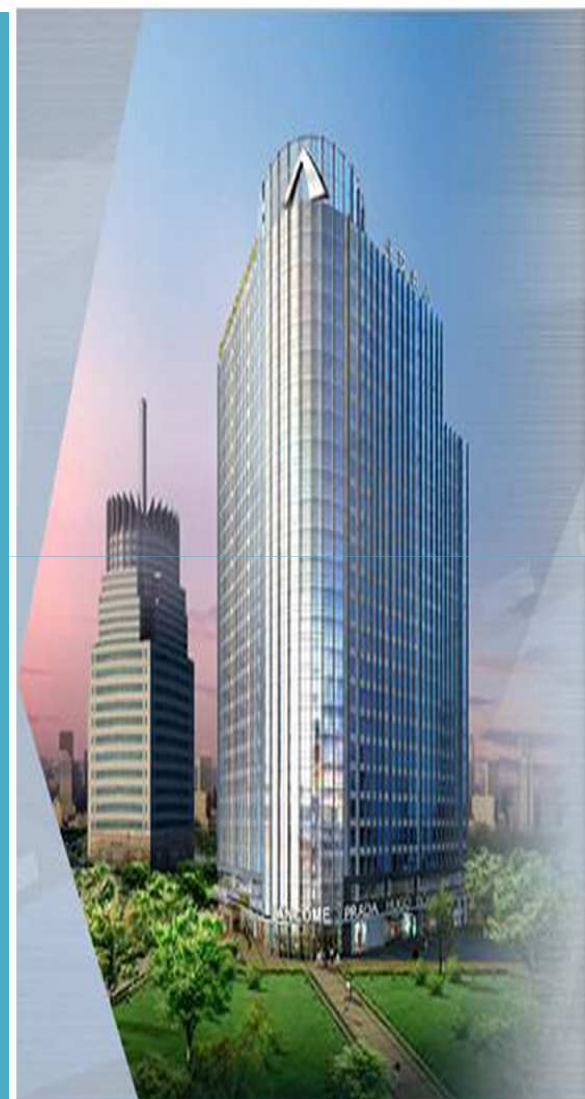
首创北环国际中心